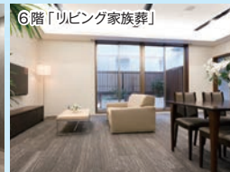
6階「リビング家族葬」