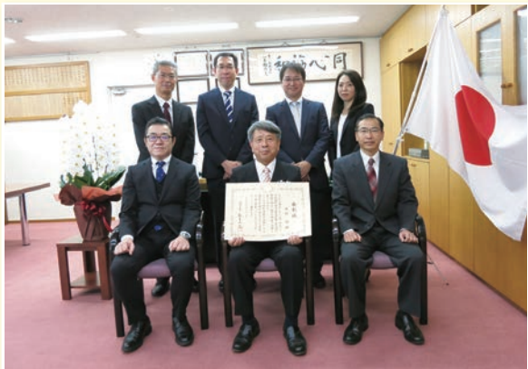
課税第一部長、緑署幹部との記念写真