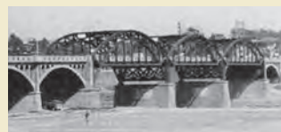
旧丸子橋 (現在は2連アーチ型)

帰りがすっかり遅くなってしまい、暗い土手を必死に自転車をこいでやっと遠くに見馴れた3連アーチ型の丸子橋が見えて来た時は本当に嬉しかった。