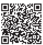
インボイス質問票 (参考:日本商工会議所 作成 法人版)