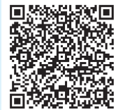
インボイス 登録状況一覧