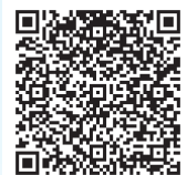
免税事業者及び その取引先の インボイス制度への 対応に関するQ&A (公正取引委員会)