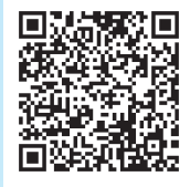
会計ソフト 「ブルーリターンA」